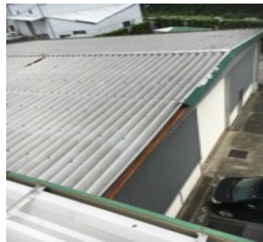
屋根及び外壁写真